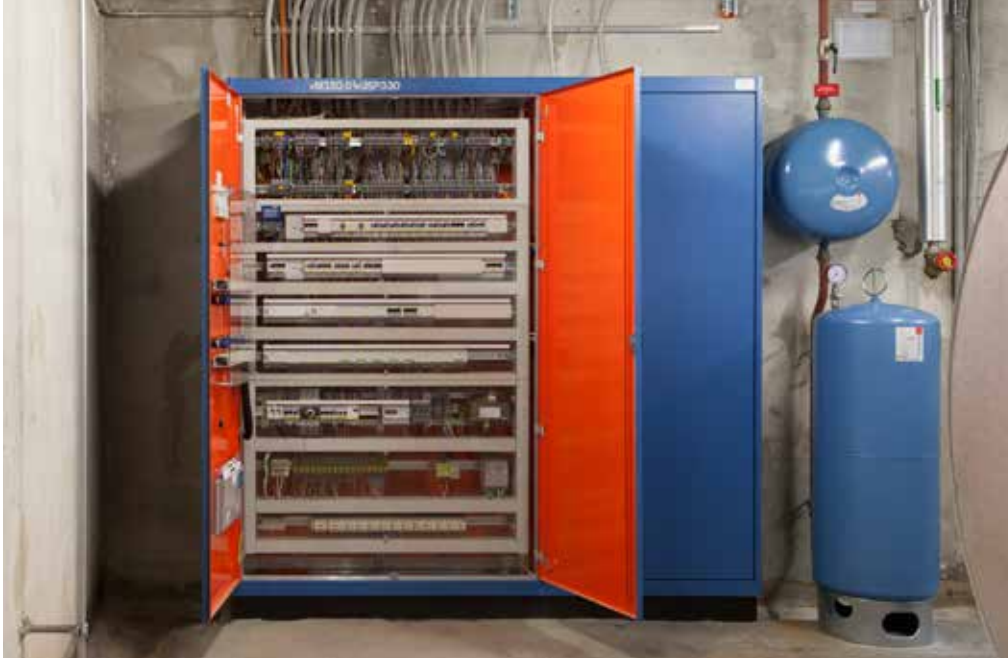
← Steuerschrank Leittechnik