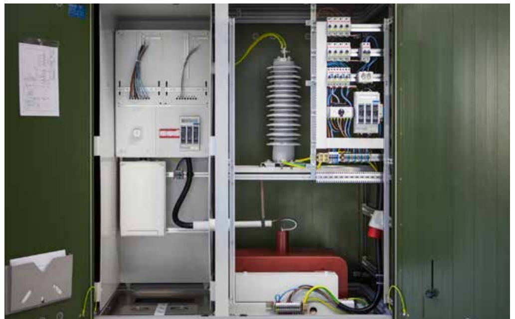
Versorgung → Mobilfunkmast 17kVA / 50 kV